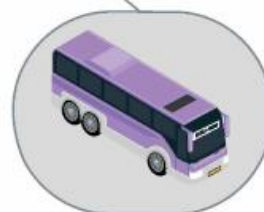
Автобус междугородного/международного следования

Проявите гражданскую позицию, поддержите «Стратегию Ноль» в России. Поделитесь с друзьями и близкими той информацией, которая показалась вам важной. Сделайте фотографию и разместите в vk ig f #СТРАТЕГИЯНОЛЬ и #РОССИЯБЕЗДТП