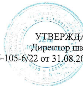
График режима предоставления питьевого молока обучающимся 1-4-х классов

УТВЕРЖДАЮ Директор школы Приказ № 01-06-105-6/22 от 31.08.2022г.